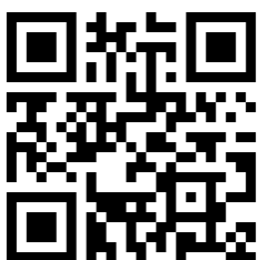
กรอกใบสมัครคัดเลือกนักเรียนทุน